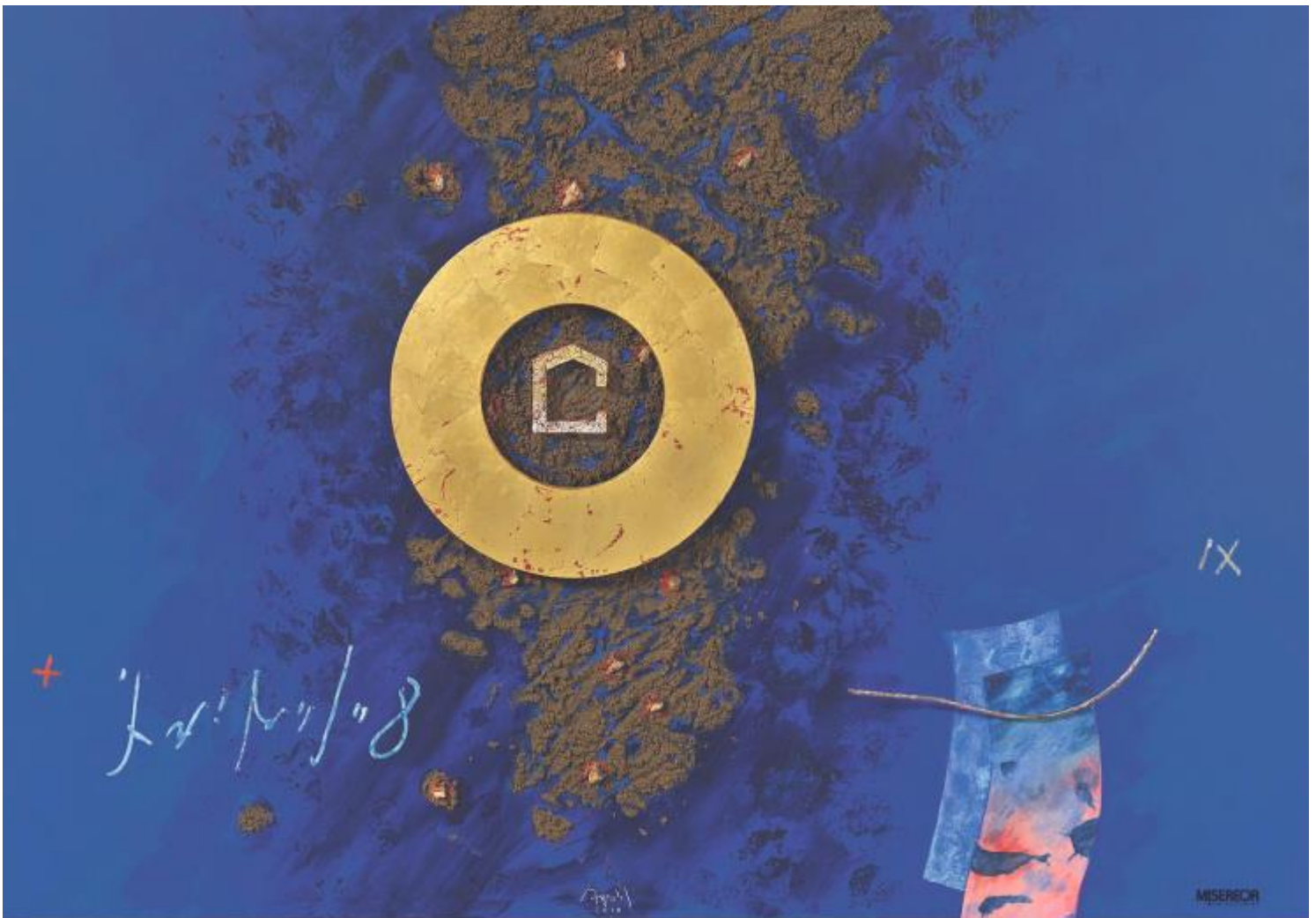
Das MISEREOR-Hungertuch 2019 „Mensch, wo bist du?“ von Uwe Appold © MISEREOR