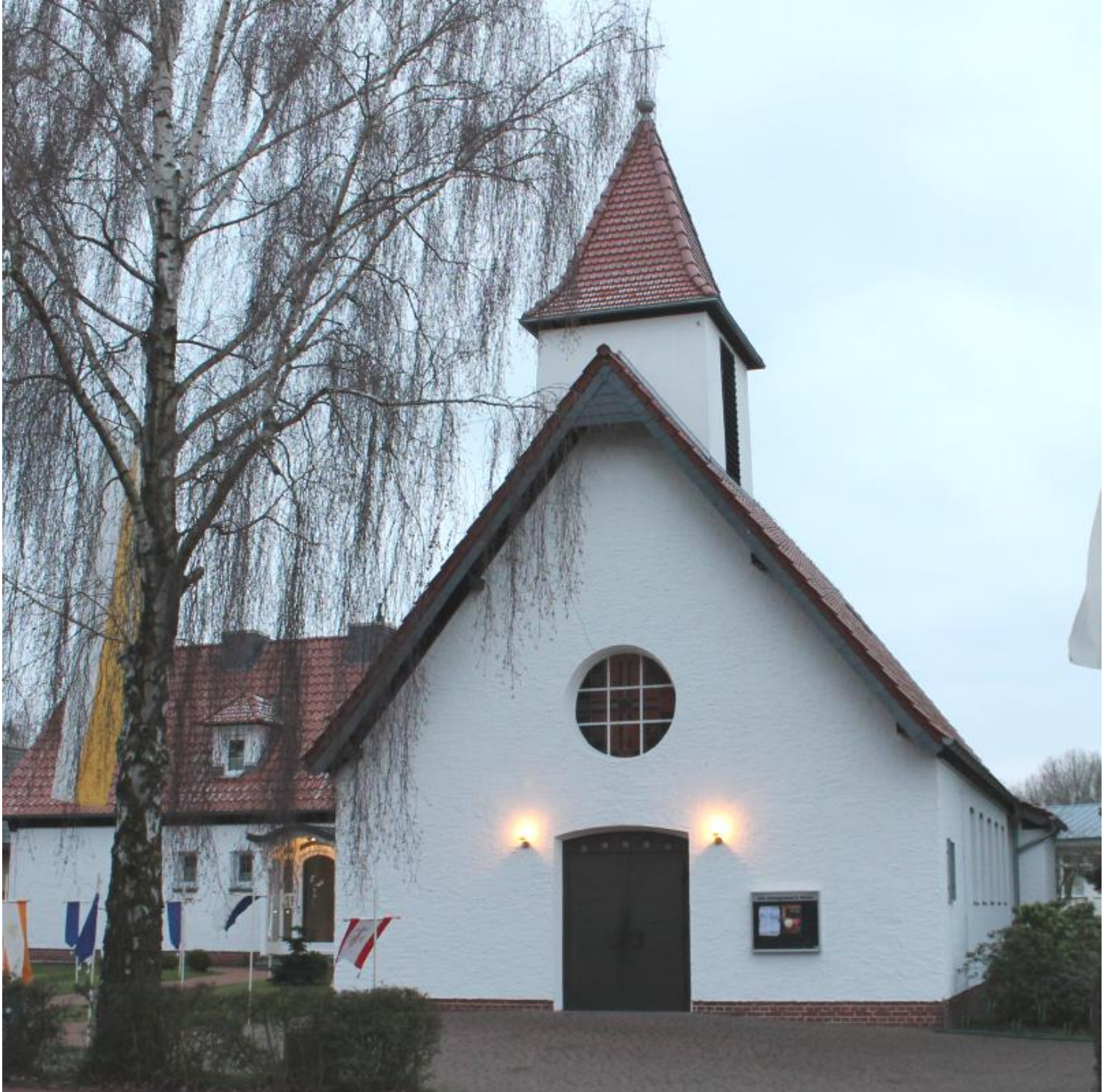
Bild: katholische Kirche St. Michael in Rahden